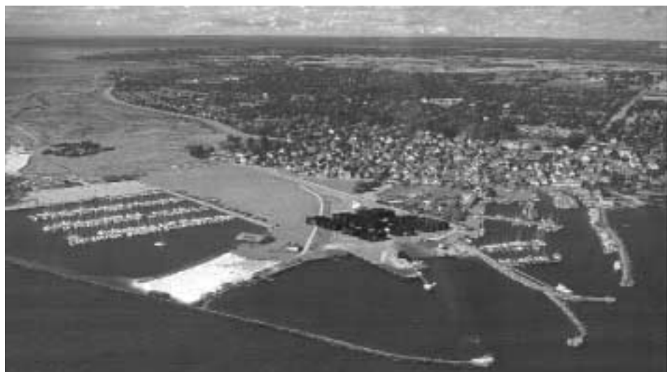
Ny bebyggelse set fra øst