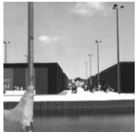
Den nye bebyggelse set fra havnefronten

teter - både dem, der er knyttet til det fysiske rum og dem, der knytter sig til de sociale og kulturelle rum - og dem der kun kan forstås i et dynamisk perspektiv af forandringer. Det ønskes at hente kvaliteterne fra det historiske over i nutiden - usentimentalt og præcist - men i sin iver efter at understrege denne usentimentale tilgang kommer beskrivelserne af det fremtidige miljø, med de noget skematiske tegninger, imidlertid tættere på stemningen i den store industrihavn end på den intime skala, der præger Dragør.